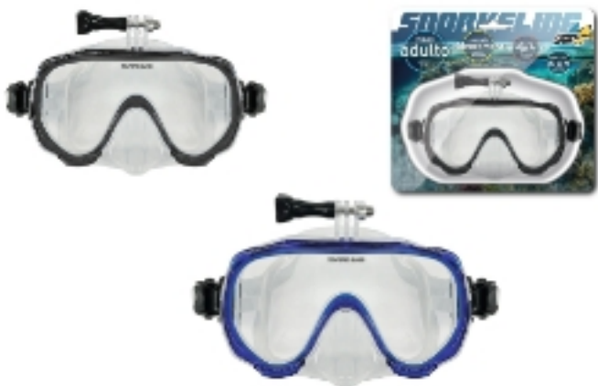
836247 MASCHERA PRO C/ATTACCO VIDEOCAMERA L