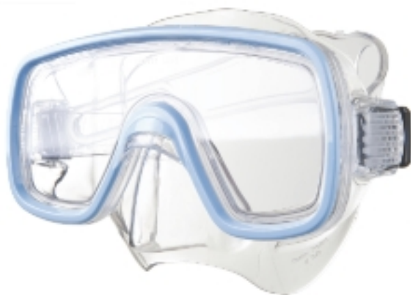
886010 MASCHERA DOMINO MD BLU M

Imballo: 1 12 12 8 || 005115 || 105109 ||