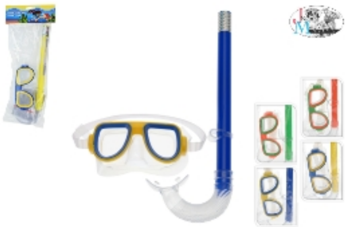
802813 SET MASCHERA+BOCCAGLIO BIMBO ASS.