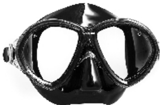
886036 MASCHERA CHANGE SR NERA L CA195X2

Imballo: 1 12 12 8 || 005115 || 195209 ||