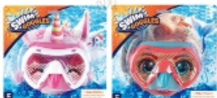
807903 MASCHERA BIMBO ANIMALI ASS.