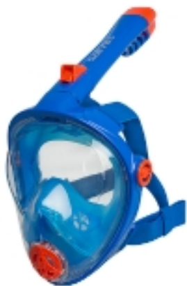
886021 MASCHERA FACCIALE CYCLOPE JUNIOR CA221S1

Imballo: 1 12 12 8 || 005115 || 904702 ||