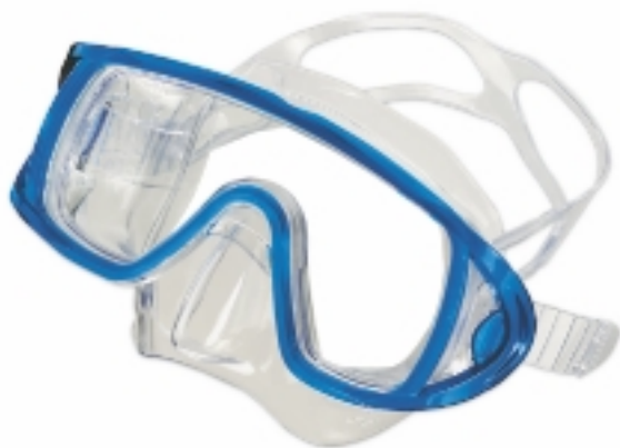
886035 MASCHERA SEAGULL SR BLU L CA154C1