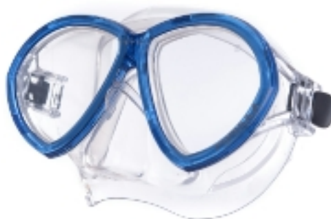
886037 MASCHERA FORMULA SILICONE SR BLU L CA196S2

Imballo: 1 12 12 8 || 005115 || 904702 ||