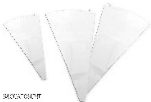
SIRINGA SACCAPOCHE COTONE

MV CF MASTER Barcode 6 6 1 4 028574 266857