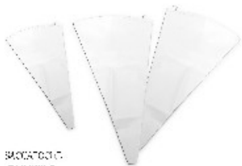
SIRINGA SACCAPOCHE COTONE