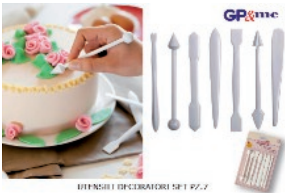
UTENSILI DECORATORI SET PZ.7

129029 UTENSILI DECORATORI DOLCETTERIA PZ.7