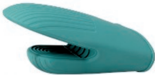
216408 PRESINA/GUANTO SILICONE HOME 20X13