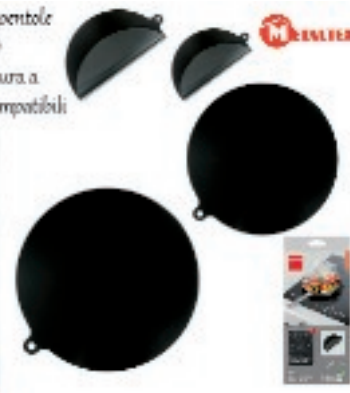
232154 PRESINE/TAPPETINO PIANO INDUZ. PZ.2 CM.22/24