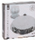
113864 SOTTOBICCHIERE INOX CM.8,4 PZ.6