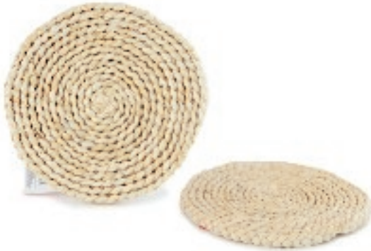
152207 SOTTOPIETOLA RATTAN CM.20