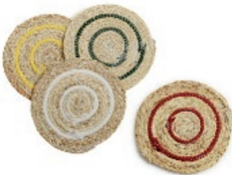
152206 SOTTOPIETOLA RATTAN/COTONE CM.20