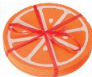
113779 SOTTOBICCHIERE PANNOLENCI PZ.4 CM.10 FRUTTA ASS.