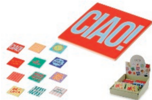
113778 SOTTOBICCHIERE MATTONELLA CM.9 SCRITTE ASS.