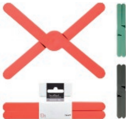
152056 SOTTOPIETOLA SALVASPAZIO HOME 20X3 ASS.