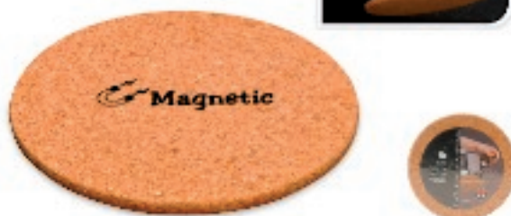
152109 SOTTOPIETOLA SUGHERO MAGNETICO CM21