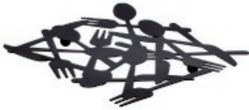
126586 SOTTOPIETOLA METALLO NERO CM.20